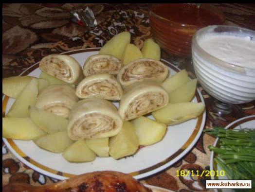
Слоеный даргинский хинкал